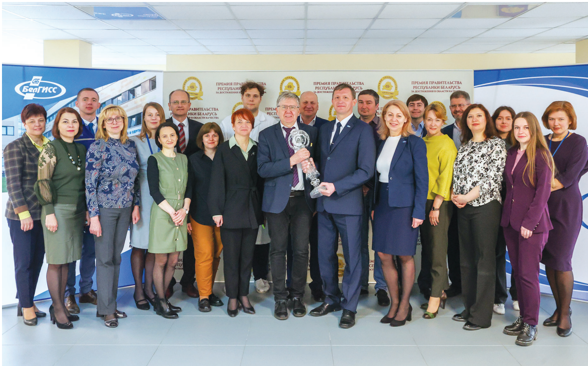
БелГИСС – лауреат Премии Правительства за качество – 2021