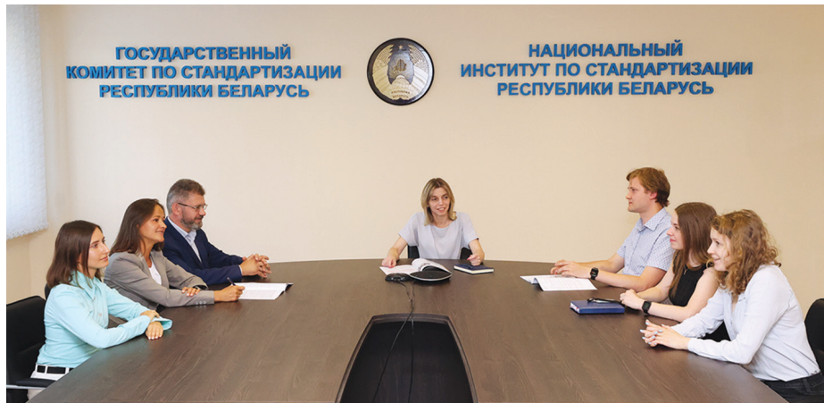
Идет обсуждение проекта нового стандарта

Тренд сегодняшнего времени – цифровизация. В прошлом году БелГИСС разработан стандарт на базовую модель архитектуры индустрии 4.0. Он вызвал большой интерес у белорусских предприятий. В этом году институтом вместе с Министерством экономики инициировано создание отдельного технического комитета по стандартизации «СМАРТ-индустрия», который будет заниматься цифровизацией процессов для реального сектора экономики.