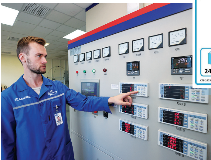
В лаборатории по энергоэффективности холодильных приборов

Здесь испытываются стиральные машины, холодильники, духовые шкафы, лампочки, телевизоры, промышленное оборудование, автомобильная техника, включая автотракторную, и ее компоненты, комбайны, электробусы. Испытания в первую очередь нацелены на проверку безопасности продукции для жизни и здоровья человека.