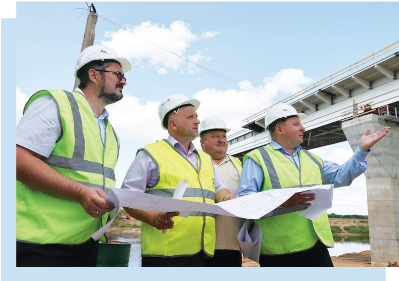
Контроль за строительством автомобильной дороги Юго-западный обход Могилева

тически проводится мониторинг соблюдения требований по их содержанию.