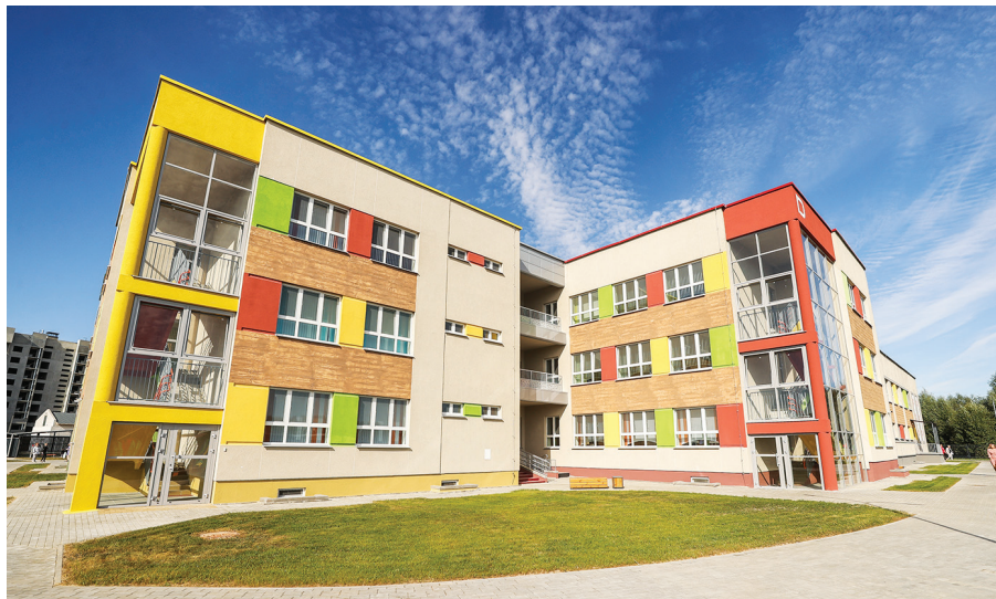
8 сентября в Жабинке открыли детский сад на 240 мест. На его строительство и обустройство потребовалось чуть менее полутора лет

Также применяются приборы по контролю соответствия проекту установки арматуры в железобетонных изделиях, содержания влаги в деревянных конструкциях и изделиях, прочности бетона колонн и перекрытий, качества уплотнения грунта в основаниях, дозиметры и другие устройства для помощи в работе инспекторов.