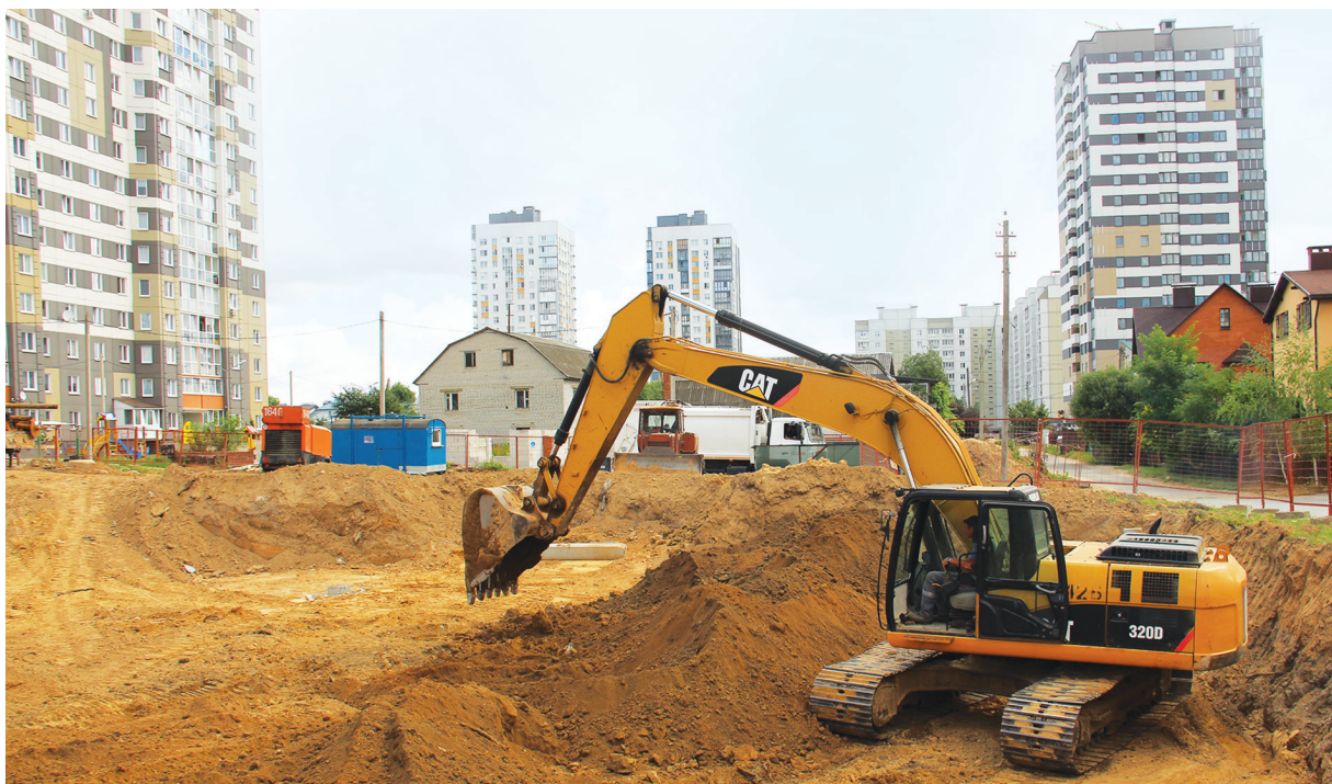
Инспектор посещает объект минимум пять раз, на всех стадиях его строительства